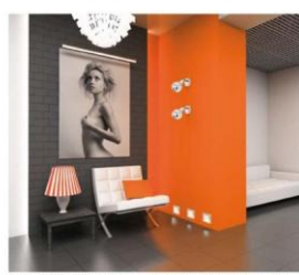
Ukoniowaniem precyzyjnie zaaranżowanej przestrzeni jest gustowne oświetlenie. Nowoczesne lampy unyknają unikalność wnętrza

Projektanci wnętrza coraz częściej stosują w aranżacjach światło nie tylko do oświetlenia, ale przede wszystkim do kreowania charakteru pomieszczenia. Doświetlenie przestrzeni kuchni, jadalni czy salonu wykreowane są lampy dające niepowtarzalny i różnorodny klimat. We wnętrzach można zastosować modele jednej kolekcji, składające się w harmonijną całość. Dodatkowe punkty doświetlające w tej samej strefie tworzą subtelny podział, w promiennie zapowietrzają przestrzeń w pomieszczeniu. - Obserwujemy coraz więcej takich klientów