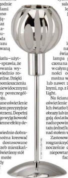
Przy sofach i fotelach efektywnie prezentują się lampy stojące – podłogowe lub stołowe

Wybierając oświetlenie należy pamiętać, że lampy o awangardowym wyrazie wniosą do wnętrza powiew świeżości, uwypuklając jego unikalność. Efektowne oświetlenie w dyskretny sposób łączący się z otoczeniem, tworzy odpowiedni klimat i daje strefy klimat oraz ekspozycje charakterystyczne detale.